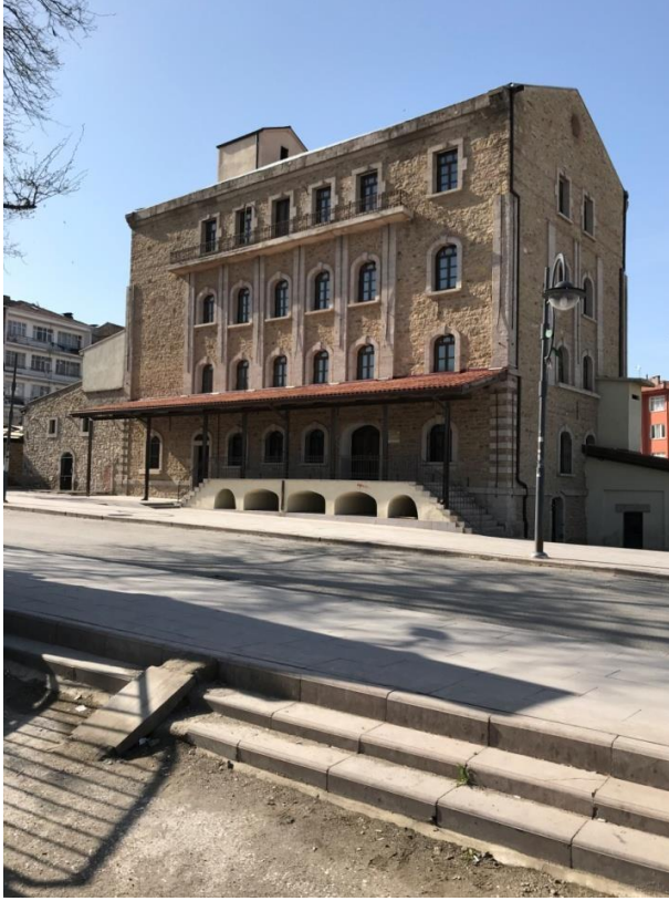
Azmi Milli Un Fabrikası

Tam da burada, mekânın insan üzerindeki görünmez etkisi hissedilmeye başlar. Juhani Pallasmaa, Tenin Gözleri'nde mimari deneyimin gözden önce bedende kurulduğunu söyler; görme duyusu mekânı kaydeder, ama hissetmek onu anlamlı kılar. Hareketin içinde kurulan algı ile durma hâlinde açığa çıkan derinlik aynı değildir. Cadde üzerinde akan bir ritim vardır; fabrikanın önünde ise zaman yoğunlaşır, genişler, bambaşka bir ağırlık kazanır.